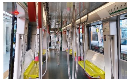
ハノイ市内を走る電車の外観および内部の様子