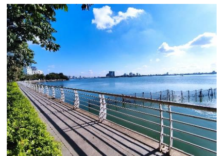
寮の近くにある西湖 (Hồ Tây)