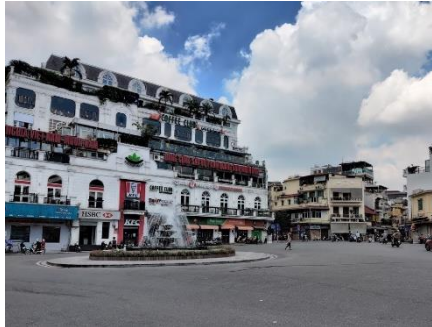
人が消えたままのハノイ中心部

新型コロナウイルスの封じ込めに成功していたベトナムですが、7月下旬にベトナム中部ダナンで感染が確認されて以降、感染が広がっています。3期生たちが暮らす首都ハノイ市内の観光地に外国人観光客の姿は見られず、旧市街もまるでシャッター街のようです。