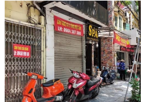
『入居者募集』の広告は増える一方

大学のあるタイビン省では特に規制は出ていませんが、今後、ハノイでの感染が増えた場合、またはタイビン省で感染が発生した場合はハノイ市とタイビン省の往来ができなくなる可能性もあります。感染が広がった場合に備え、大学での日本語教育に関してオンライン授業の整備を進めています。